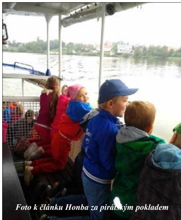
Foto k článku Honba za pirátským pokladem