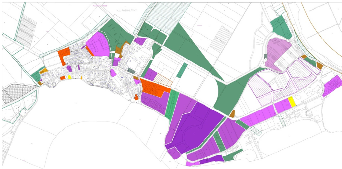
Obr.: schéma etapizace (plná barva - I. etapa ; šrafa – II. etapa ; obrys – III. etapa)

Splnění výše uvedených podmínek pro zahájení další etapy posuzuje úřad územního plánování.