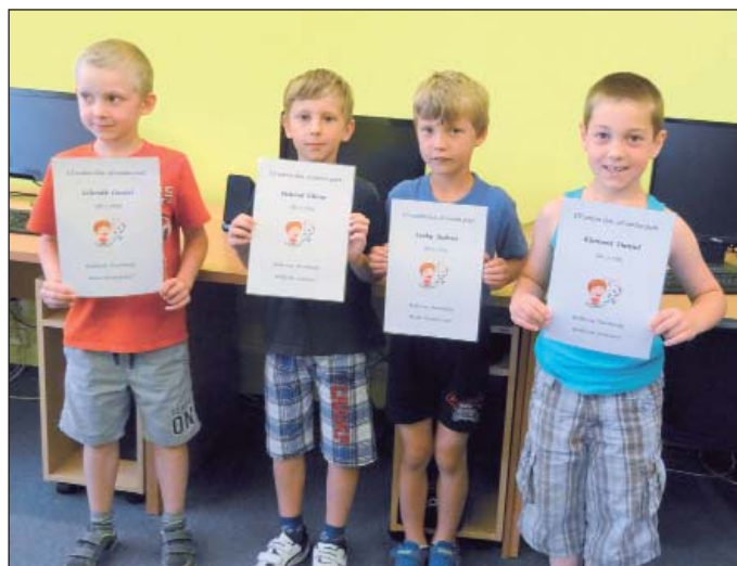
Velké poděkování patří Obecnímu úřadu v Pasohlávkách, který na tuto akci poskytl finanční příspěvek.

Žáci, paní knihovnici a skřítku knihovničkoví předvedli své dovednosti (ze slabik tvořili slova, do neúplných slov doplňovali písmena apod.) a šlo jim to opravdu skvěle. Na závěr našeho setkání si děti v knihovně zasoutěžily. V soutěžní hře na živé PEXESO si děti procvičily paměť a soustředění, hra na ČOKOLÁDU byla nejen mléčně čokoládová, ale i náročná na oblékání a u hry MUMIE byla velká spotřeba toaletního papíru. Myslím si, že se dětem v knihovně líbilo.